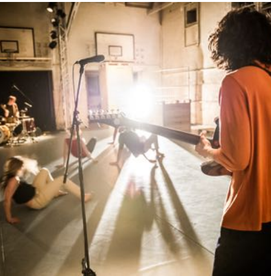
The Basement - Halle Ostkreuz, Berling (DE)

De Dansers herneemt voorstellingen, om altijd voor alle leeftijden een voorstelling op het repertoire te hebben. Ook bewijzen eerdere ervaringen met internationaal tourende voorstellingen ( Droomstad , Tetris ) dat er meerdere seizoenen nodig zijn om mee te draaien in de dynamiek van internationale festivals. Uit het vorige kunstenplan herneemt De Dansers drie voorstellingen: