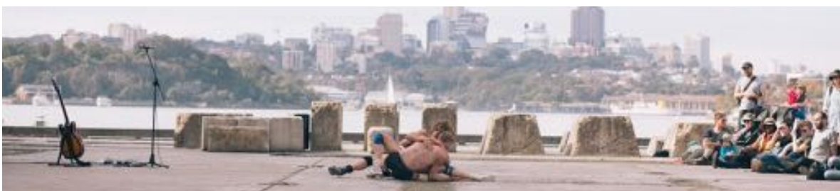
Betonder - Underbelly Arts Festival Sydney (AUS)

Door de samenwerking met Theater Strahl en het gezamenlijk optrekken in de acquisitie wordt er veel in Duitsland gespeeld en heeft De Dansers daar ook een stevig netwerk. In het Verenigd Koninkrijk en Ierland bouwt De Dansers een netwerk op dat in 2016 voor het eerst wordt aangesproken voor een tournee, om vervolgens uitgebouwd te worden: Fringe en Imagine Festival Edinburg, The Unicorn en Dance Umbrella London, Baboro Festival in Galway (IE). Met Cheryle Hansen van agentschap Kid's Entertainment (USA) onderzoekt De Dansers momenteel de Amerikaanse afzetmarkt.