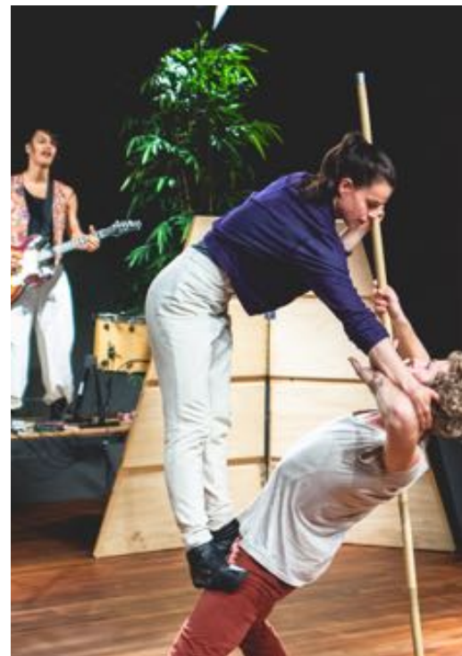
Pokon - Theater Kikker, Utrecht (NL)