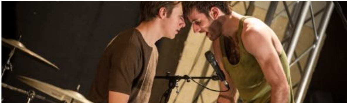
The Basement - Halle Ostkreuz, Berlin (DE)

In voorstellingen van De Dansers komen dans en muziek gelijkwaardig samen in een uitingsvorm tussen dansvoorstelling en concert. De spelers staan op de vloer als een band van dansers en muzikanten, die samen een gesamtkunstwerk bouwen. De Dansers kiest voor deze combinatie van disciplines omdat ze elkaar versterken. De dans belichaamt, materialiseert, gaat op de huid zitten. Muziek intensiveert en voegt een verdiepende emotionele laag toe, die resoneert in het gehoor, het geheugen en de onderbuik. Daarbij is muziek voor publiek dat onbekend is met dans vaak een toegangspoort om dans beter te begrijpen. De gemeenschappelijke basis om met deze disciplines het podium te delen is dit: de muziek en dans communiceren op hetzelfde niveau, wanneer ze een pure uiting van emotionele beleving zijn.