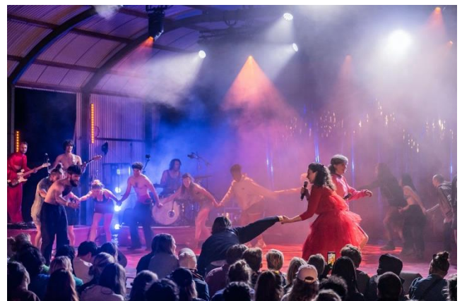
Club Gewalt en De Dansers op Down The Rabbit Hole